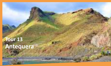
Tour 13 Antequera