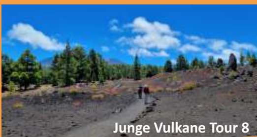
Junge Vulkane Tour 8