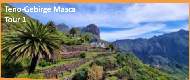
Teno-Gebirge Masca Tour 1