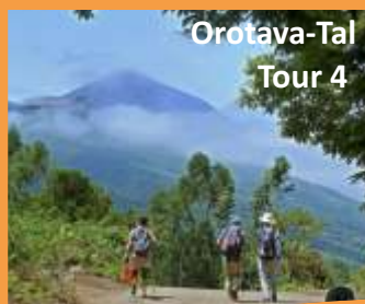
Orotava-Tal Tour 4