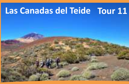
Las Canadas del Teide