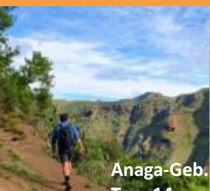
Anaga-Geb. Tour 14